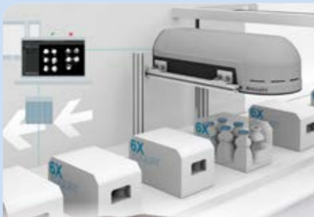
BALLUFF Smart 3D, 3D Stereo ja Radarlager kamerat