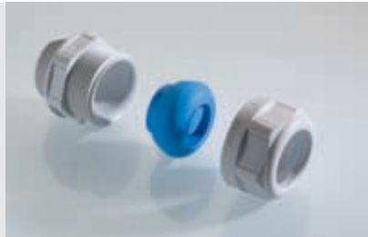
Abb. 1 Fig. 1