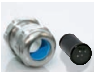
Abb. 4 Fig. 4